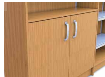
Caisson de réserve avec portes