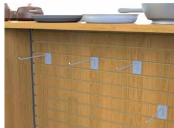
Crochets pour dos de slatwall