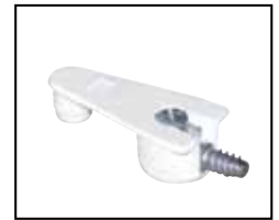
Fixation « Cam »