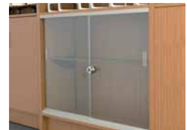
Section vitrée avec serrure