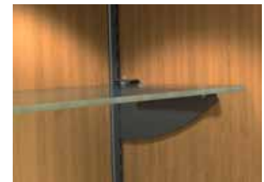
Tablettes de verre