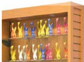
Côtés de slatwall pour accrochage supplémentaire