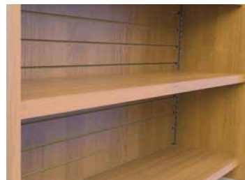
Tablettes en bois pour dos de slatwall