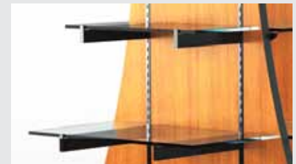
Tablettes en verre avec supports de métal