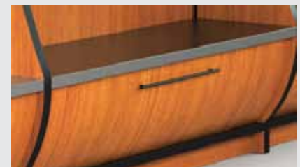
Tiroir concave avec dessus en MDF recouvert d'un laminé