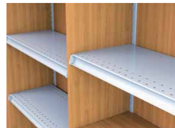
Tablettes en métal