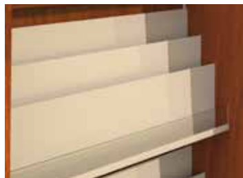
Tablettes de métal en escalier (3 ou 4) avec clôture d'acrylique au devant